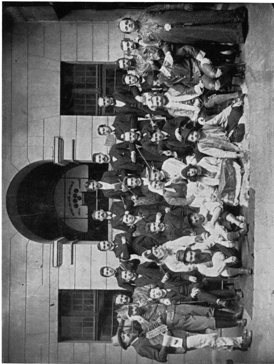
Az egyik kollégiumi színdarab előadói együttese az Eötvös-kollégium udvarán. A felső sorban középen Kodály Zoltán. — Eredeti fénykép. 22 × 27,5 cm.