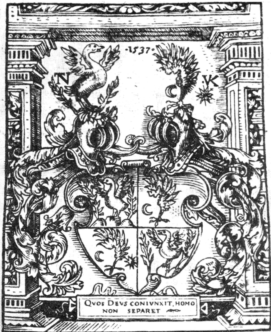
NÁDASDY Tamás és KANIZSAY Orsolya egyesített címere. SYLVESTER: Uj Testamentum (Sárvár-Újsziget, 1541.)