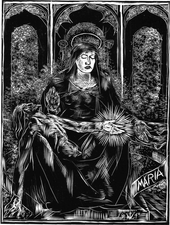
Varga Nándor Lajos : A fametszet című könyvéből.