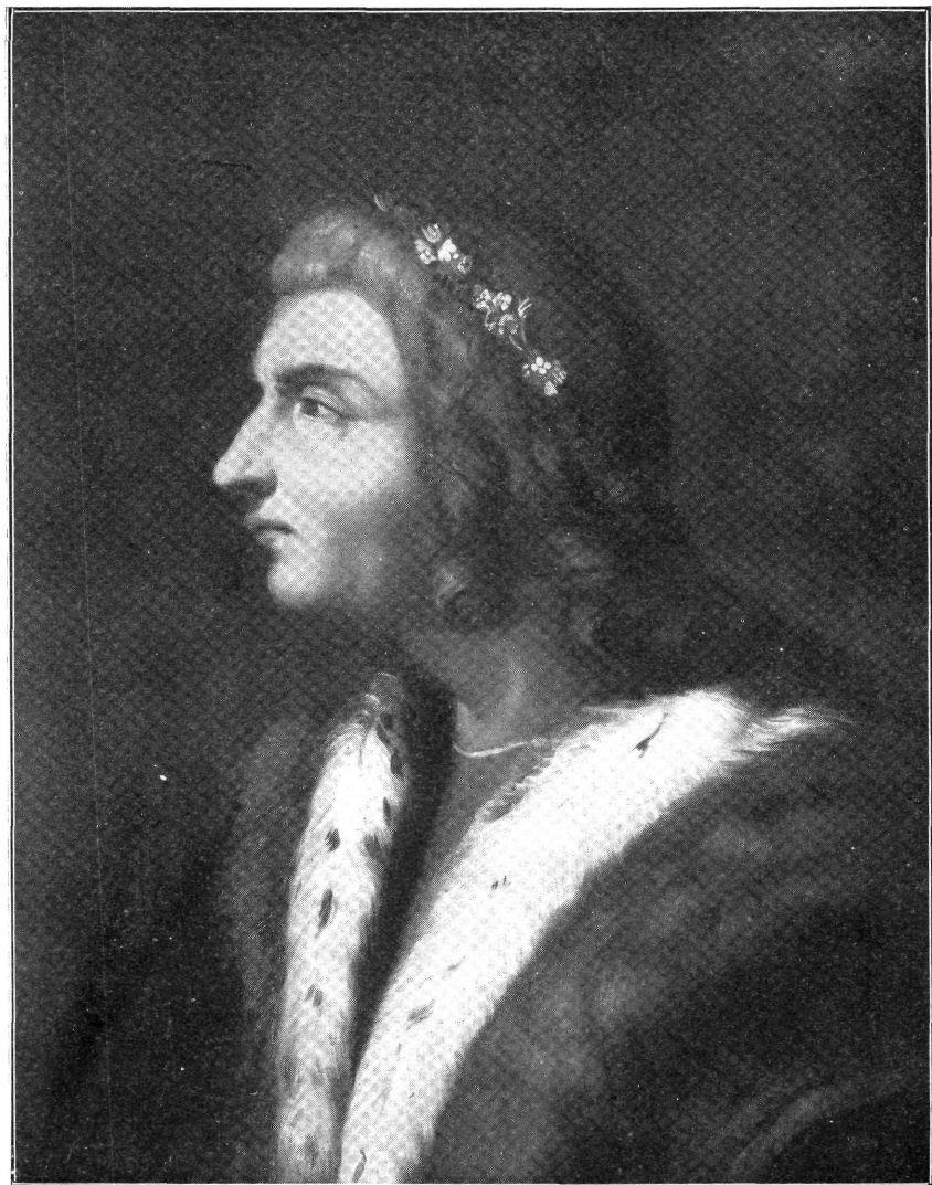
Mátyás király arcképe RUBENS P. P.-tól az anversi Plantin-Moretus múzeumban.