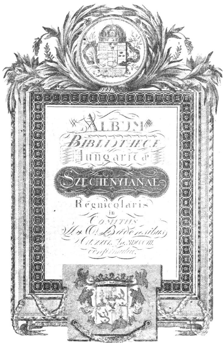
A KÖNYVTÁR ELSŐ VENDÉGKÖNYVÉNEK CZÍMLAPJA.