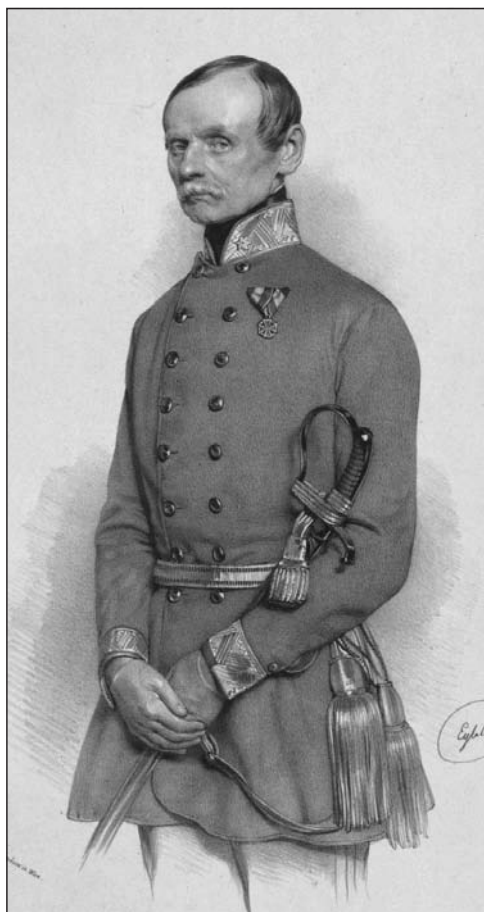
Emanuel Zitta portréja

után készült. Ez utóbbi magyarázhatja is a fent említett anomáliákat, melyek ezen, egy minden valószínűség szerint egy kései jelentéshez, vagy memoárhoz szánt térképen feltehetőek.