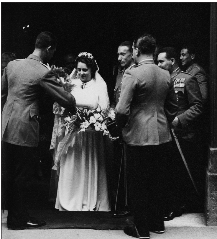
Tiszti esküvő, 1944 nyarán, a „századosok” egy csoportjával 8

Ami a kontrollcsoportokat illeti, kérdés, hogy ez esetben vajon mifélek jöhetnek – jöhettek volna számba? Civilekői? Netán más tiszti évfjاراتoké? Szinkron vagy diakron életkori közösségek? Eltérő társadalmi osztályok, rétegek hasonló korú és nagyságú cso-