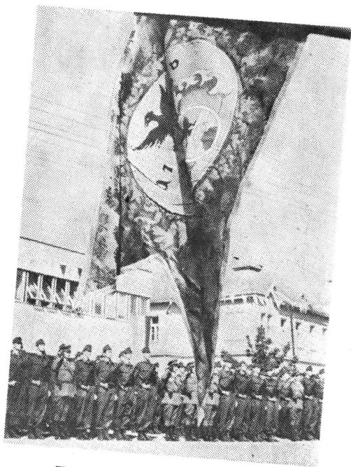
Eskütétel Kiskőrösön — 1969