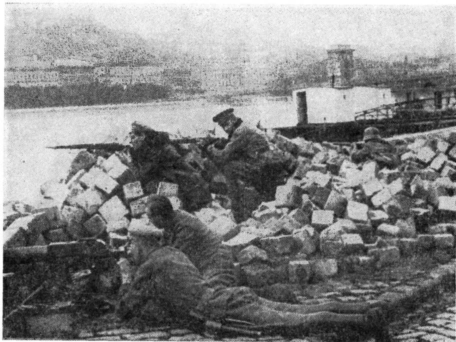
Harc az ellenforradalmi monitorok ellen — 1919. június 24