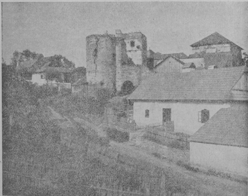
A márkusfalvi ősi Máriássy vár romjai. Ennek jobboldali fedett és restaurált részében volt a legújabb időkig a családi levéltár elhelyezve.

is, meg nem is. Megkérdezte udvari ágensét, az sem tud semmiféle áthelyezésről, de mindez nem számít, mert a katonaságnál bármely órában váratlanul bekövetkezhet valami változás. Annyi bizonyos, hogy a katona nem a maga urá, azt köteles tenni, amit parancsolnak neki és mindenhez hozzá kell szoknia. Mivel a fenti szóbeszédet parancs nem követte, tehát az áthelyezésről szóló hír nem igaz, azonban valahova végre mégis kerülnie kell, mert ideiglenes minőségben örökké itt nem maradhat. 109