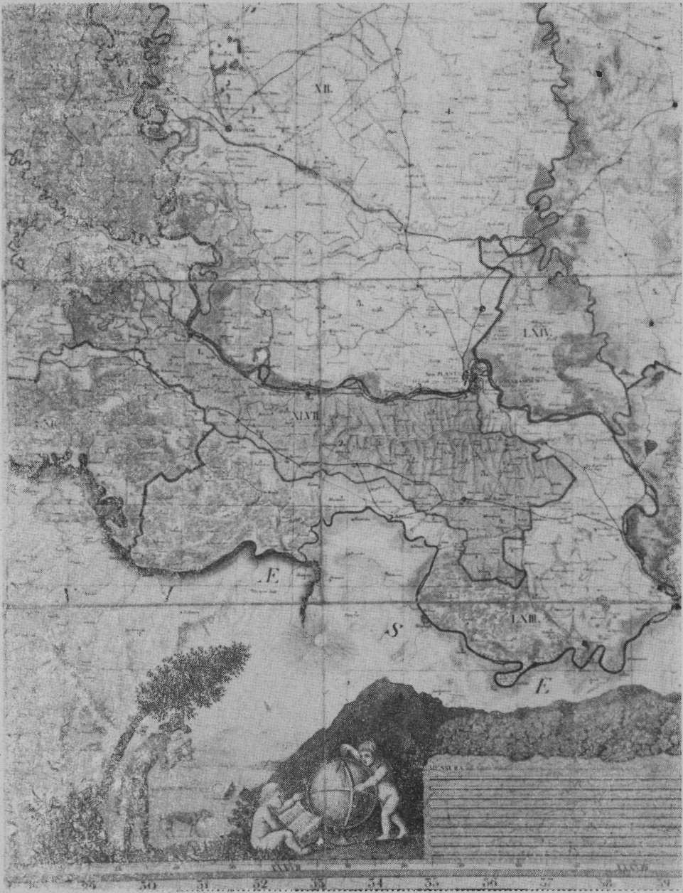
Térképezési jelenet Lipszky térképén a kilencféle aránymérték-táblázat mellett