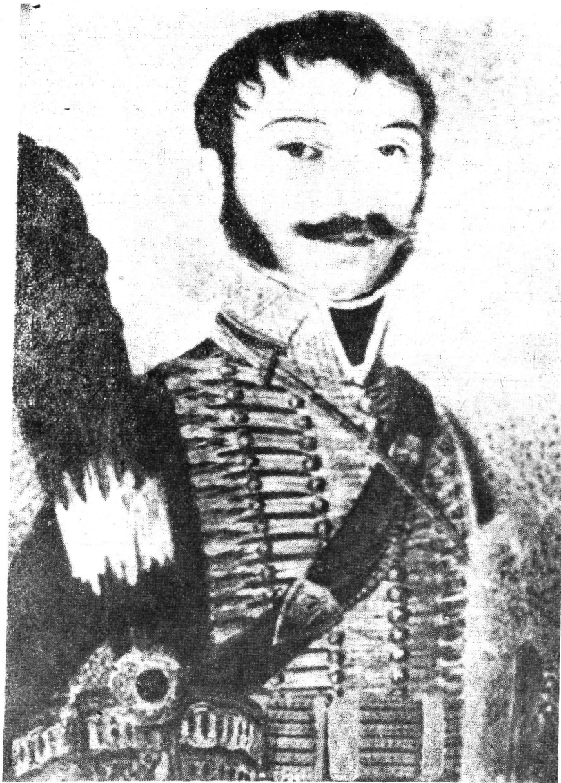
Lipszky János huszártiszt (1766—1826)

támogató segítségét, aki hosszú évek múltán is érdeklődéssel kísérte pályafutását.