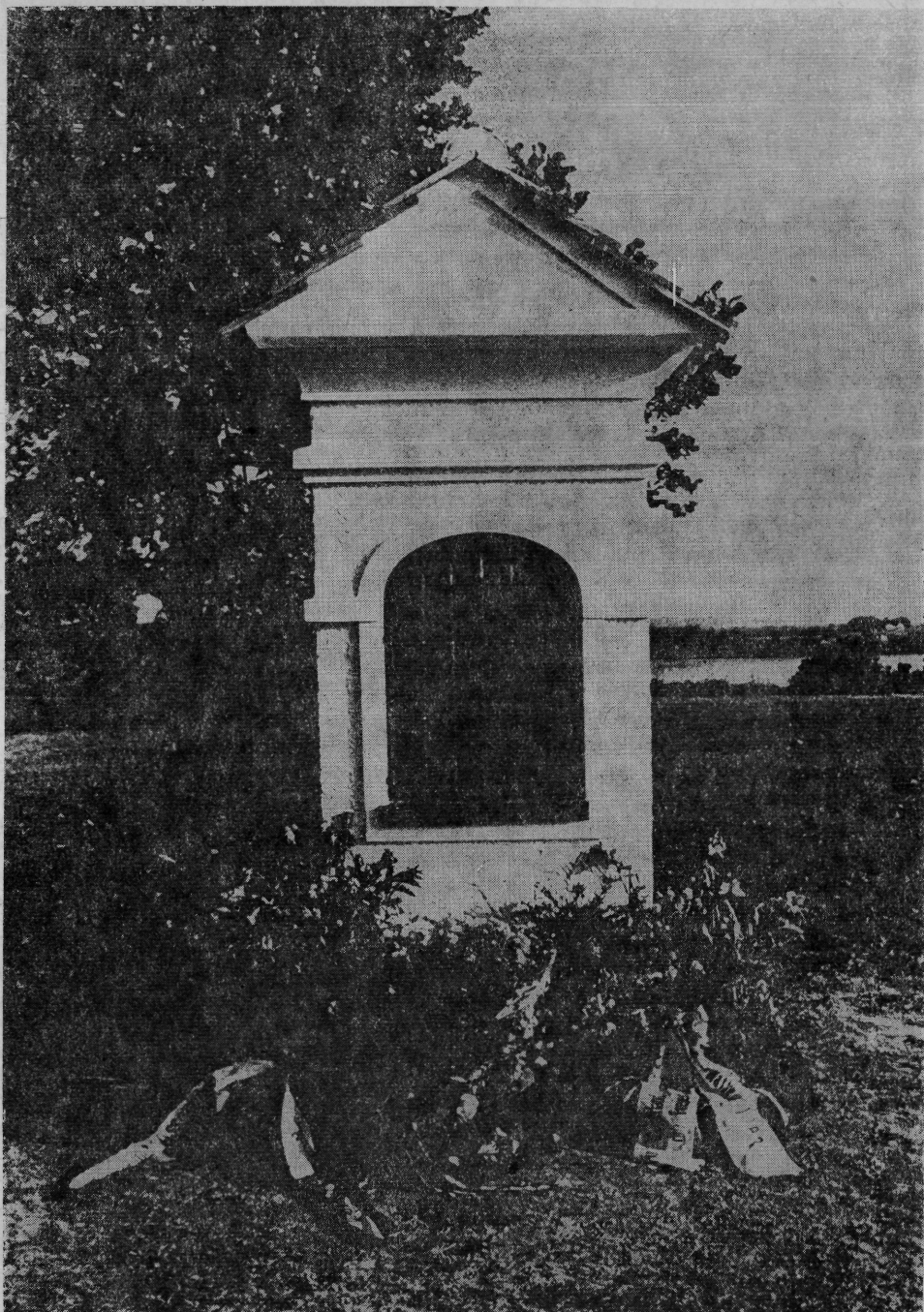
A korona rejtekhelyét jelölő, 1983-ban állított emlékoszlop. (A térképen 2-es és 3-as számmal jelölt pontok között áll.)