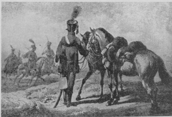
Magyar huszárok 1812-ből.