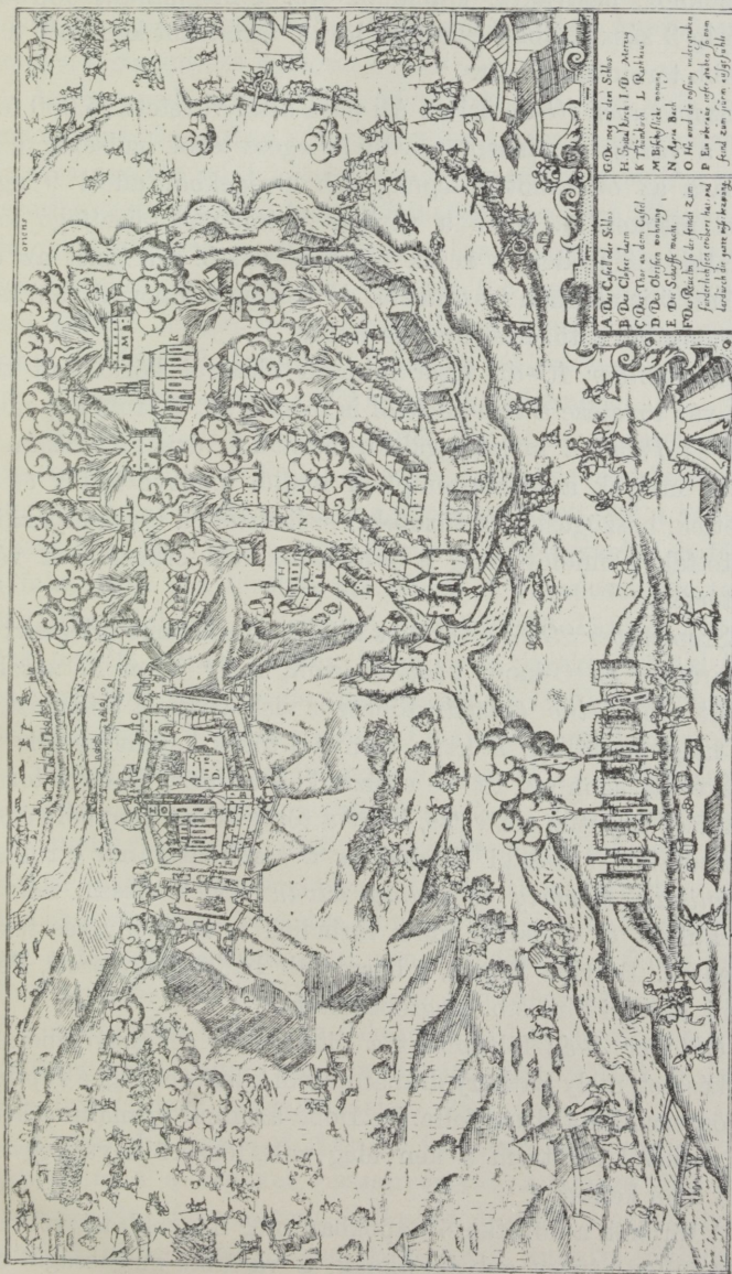
Eger a XVI. században.