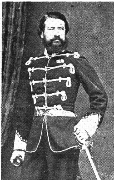
Gál Sándor Itáliában készült fényképe

Az 1851 őszen Angliába érkező Kossuth november 19-én Gál Sándort az erdélyi felszabadító sereg főparancsnokává nevezte ki. 7 Működési területe a kinevezés szerint – természetesen Erdély mellett – kiterjedt Máramaros és Szatmár megyére is azzal, hogy az újabb felkelés kitörésekor azonnal a csapatok élére kell állnia, addig a már megkezdett szervezkedést kell folytatnia. Kossuth mintegy öt hónappal korábban Makk József ezredesnek, Komárom korábbi tüzérparancsnokának adott hasonló felhatalmazást. 8 A két ezredes megbízatása átfedte egymást, hiszen Makk a teljes hazai szervezkedés irányítását kapta feladatául. Kossuth később tovább bővítette Gál hatáskörét, 1852. április 12-én teljhatalmú törökországi ügyvivőjévé nevezte ki, s irányítása alá rendelte összes ottani megbízottját. 9