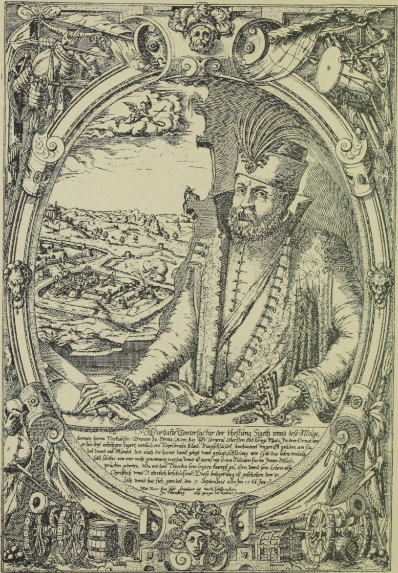
ZRÍNYI MIKLÓS, A SZIGETVÁRI.