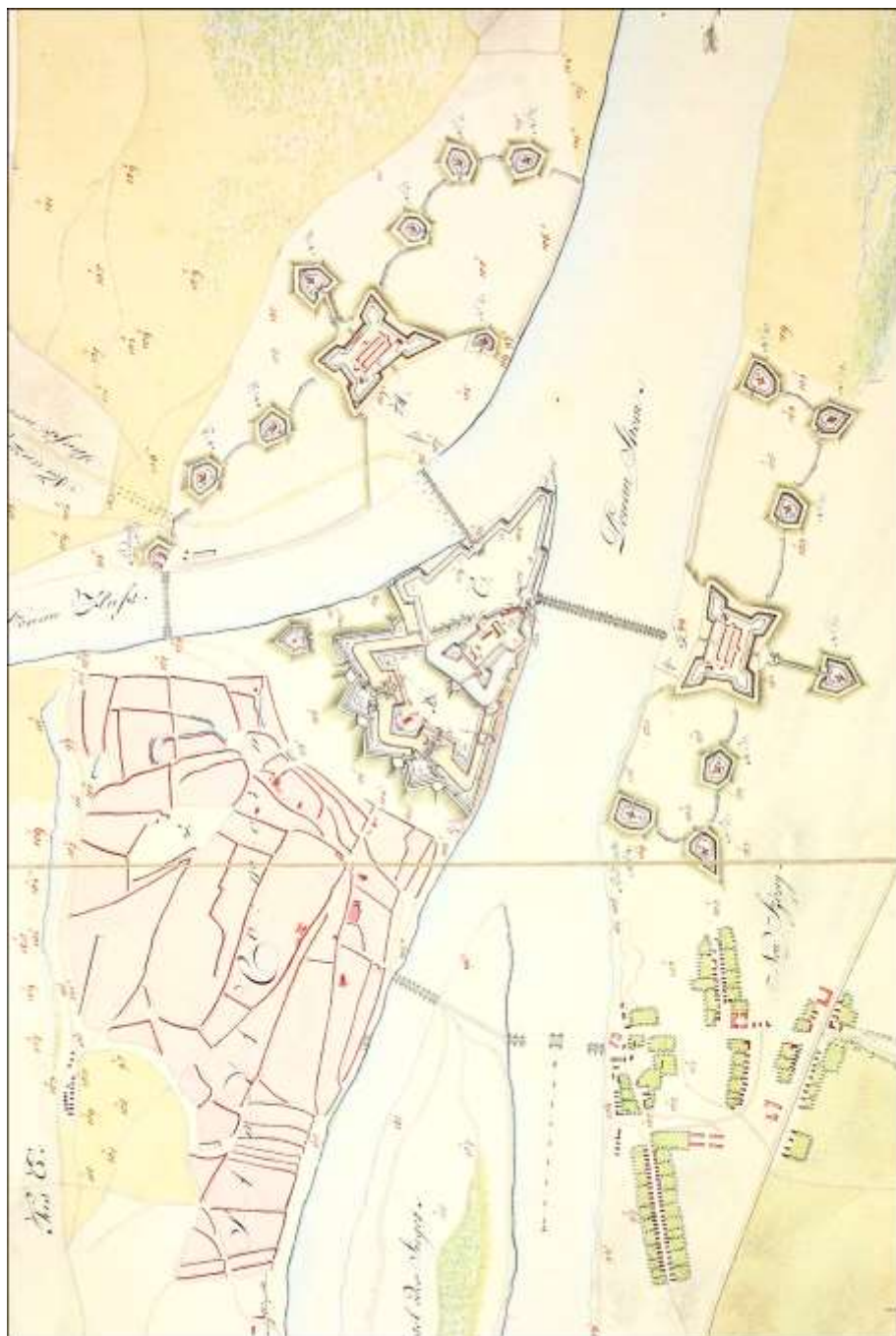
Komárom vára az 1808-as építkezések után