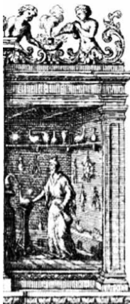
Az alkímista Címlapkép részlete Shaftesbury: Characteristicks, 1714.

A fogalmi, nyelvi és tartalmi változások pedig nem maradtak a vizsgálati terekben: a megfigyelők először egymás között, majd nagyobb körben, a levelezésükben és publikációikban cseréltek eszmét. 29 Bobory jól ismeri ugyan az elmúlt évek szakirodalmát, de a természetfilozófia gyakorlatának bemutatása közben egyszerűen nem reflektált a megfigyelés kultúrájának ebbéli átalakulására. Pedig éppen Batthyány és köre gyakorlata igazolja vissza és erősíti meg ezt a változást. Bobory nem tér ki a tudósok köztársasága gyakorlatának és „hasznának” részletesebb értékelésére, holott könyvének egyik alapvetése az, hogy a korabeli „ismeretgyártás” kommunikációja és a megfigyelések megosztása a Batthyány-kör tevékenységéhez hozzátartozott. 30