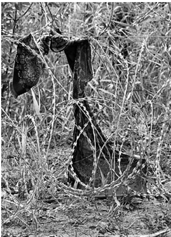
A hónap műtárgya: Muszlim női kendő Néprajzi Múzeum, 2015. november

lehet azoknak a csoportoknak, amelyek az adott projektben együtt dolgoznak a muzeológussal, a kurátorral. Természetesen az egyes területeken mást és mást jelent a részvétel, ennek tisztázásában segít az a modell, az ún. „demokratikus múzeum »participációs technológiáinak« elmélete”, amelyet észt muzeológusok 17 fejlesztettek ki saját intézményük megújítására (281. old.). Ez a részvételi akciókutatás keretei között létrehozott modell megkülönbözteti a kulturális intézmények (így a múzeum) különböző funkcióit és ezekhez igazodva adja meg a participáció