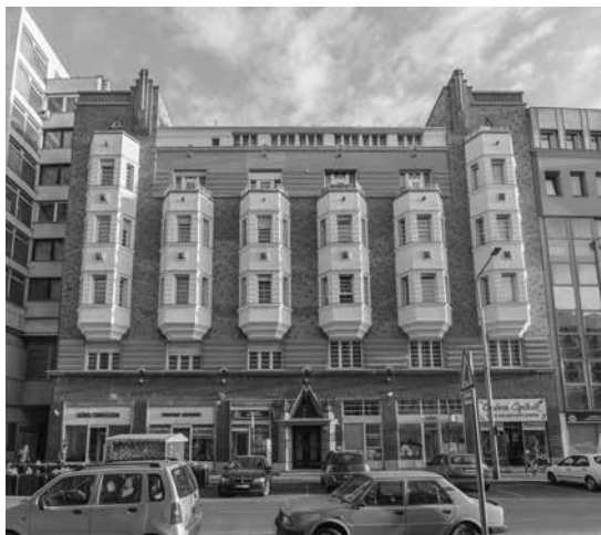
Debreceni izraelita hitközség bérháza

Jó látni egyfelől, hogy például Sajó „újrafelfedezésével” a magyar art deco építészet is helyet kap a magyar építészet történetében, 7 s szintén jó látni – visszatérve Bolla könyvére –, hogy egy-egy életműben (például a Sajóéban) a megvalósult épületek listájában mindenféle kisebbrendűség nélkül kerül egymás mellé Debrecen és New York, vagy akár Szolnok és Párizs, mert a magyar építészek egy része valóban világpolgár volt. A Besztercebányáról induló Hugyecz László – akire már 2008-ban széles körű figyelem irányult, de akkor még az art deco terminust többé-kevésbé kerülvén 8 – például a legnagyobb sikereit Sanghajban érte el. Az olvasónak mégis az a benyomása, hogy a magyar art deco építészet egészét mégsem tudjuk a kisebbrendűség érzete nélkül kezelni. Egyrészt a kortársakhoz, másrészt a történeti előzményekhez, különösen a szecesszióhoz viszonyítva. Az első kötet hátlapján például a magyar szecessziós építés-