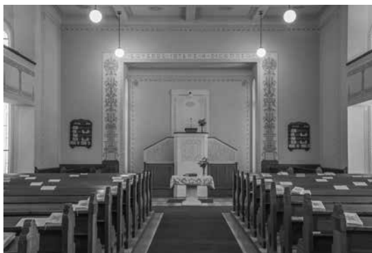
Református templom, Szombathely

cia”, amelyet „az építészettörténeti reminiscenciák, másfelől az ornamentika most már végsőig finomított egyéni változata” tart távol a korszerűségtől. 24 Lehetséges, hogy a fejlődési vonalak is cikcakkosak volnának? Ha ezt elfogadjuk, akkor elmozdulás történhet Kozma 1910-es évekbeli munkáinak, ezzel együtt Lajta Béla és Maróti Géza építészeti munkásságának stiláris alapú értékelésében is: utóbbi két építész szecessziós-premodernként tartjuk számon,