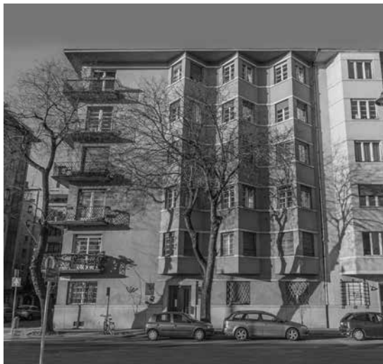
Budapesti bérház, Bem rakpart 25/a

Felvetődhet az emlékek területi szempontú gyűjtése kapcsán egy merőben gyakorlati kérdés is. Ha