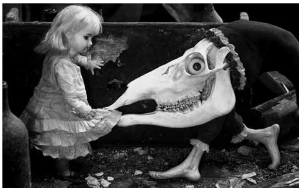
Jan Švankmajer: Alice . Svájci–csehszlovák film, 1987.

nehezen szabadult – ha egyáltalán – a kutatásokban oly sokat boncolgatott kettősségtől, hogy Carroll hol műzsájától megihletett zseninek, hol bizarr, másokat elnyomó liliomtiprónak mutatkozik. A Carroll-mitosz szexuáletikai újraolvasási kényszerén már sok szempontból sikerült túllépnie annak a Christopher Hollingsworth által szerkesztett 2009-es tanulmánykötetnek ( Alice Beyond Wonderland. Essays for the Twenty-First Century ), amelynek darabjai az irodalom- és a kultúratudomány ígéretesebb indíttatásával és kritikai eszköztárával közelítik meg az Alice-jelen- séget.