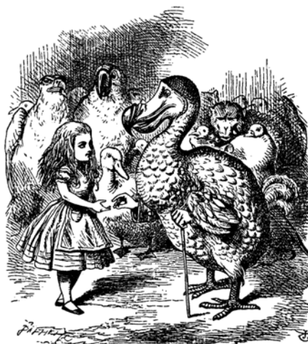
John Tenniel: Alice találkozik Dodóval. Fametszet az 1865-ös kiadásban