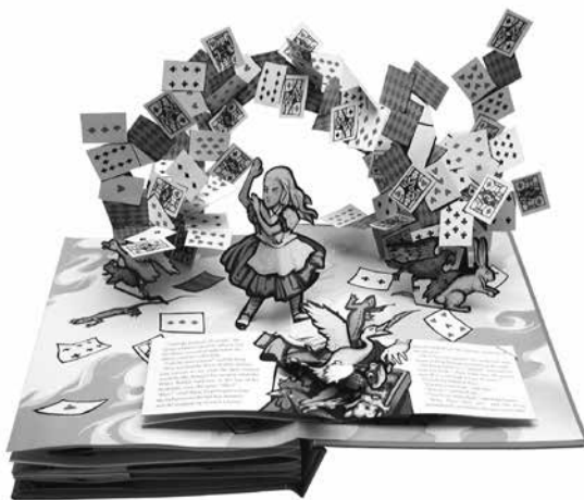
Robert Sabuda: Alice's Adventures in Wonderland. A Pop-Up Book Adaptation. (Little Simon and Schuster, 2003) alapján. Alice for the iPad. Version 3.01. Atomic Antelope, 2010.

A cseh Jan Švankmajer 1987-es bábfilmje ( Něco z Alenky ), az angol Angela Carternek a bábfilmre „válaszó” 1990-es novellája ( Alice in Prague or the Curious Room ), majd pedig az amerikai Rikki Ducornet 1994-es regénye ( Jade Cabinet ) olyan palimpszeszthármas alkot, amelynek elemzése a filmes és írott „textusok” egymásra mutató játékában boncolja tovább a testiség vetületeit. A nyelvi nonszensz szürreális látványvilággal történő kifejezését mind a filmvásznon, mind a prózaszövegek történetkezelésében megfigyelhetjük. Mindhárom munkában közös a carrolli nonszensz csodának, mely eredetileg többnyire nyelvi-logikai jelenség, az anyagi világba vetített megfelelője (életre kelő, enyészetnek indult játékok, XVI. századi bizarr kuriózumgyűjtemény, papírra vetett kézírás és testi eltűnés – dematerializálódás).