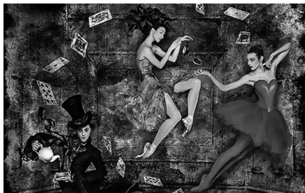
The Royal Ballet: Alice . Royal Opera House, London, 2011. Zene: Joby Talbot, koreográfia: Christopher Wheeldon

A bevezetőben a carrolli művet a legkülönfélébb feldolgozásokra, rájátszásokra alkalmassá tevő sajtó- tasságként a kétértelműséget ( ambiguity ) emeli ki. Ezt követi négy tematikusan szervezett fejezet. Az elsőben ( Transmedia Wonderland ) magára a feldolgo-