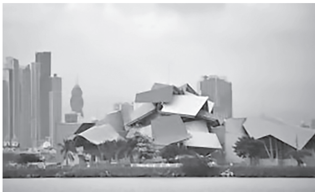
Frank Gehry: A biodiverzitás múzeuma, Panama City

szabályokkal irányított, a kultúra magányos befogadását támogató, klasszikus intézményi modellt. 17 Az időszaki kiállítások és a hozzájuk kapcsolódó események, éttermek és múzeumshopok ennek a változásnak a kényelmesebb és intenzívebb múzeumlátogatást biztosító elemei. A kasszasikerre tervezett kiállítások (ún. blockbuster kiállítások) rendre látogatói rekordokat döntenek, a tömegkultúra tárgyait bemutató tárlatok pedig folyamatosan tágítják a múzeumba járók közösségét. Ideális esetben a nagy sikerű kiállításokból származó bevételek lehetőséget teremtenek arra,