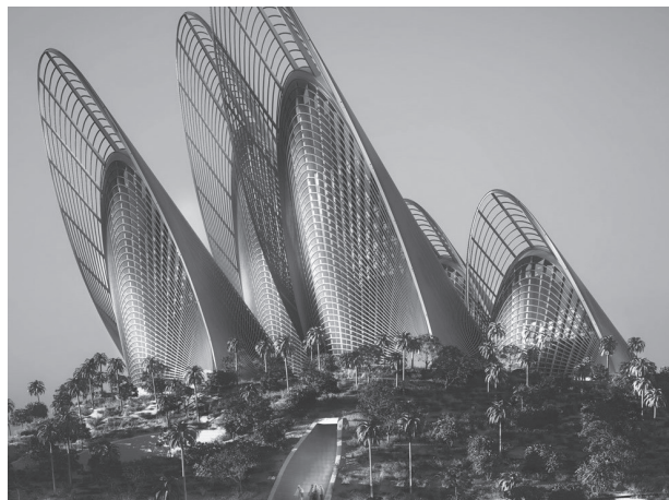
Norman Foster: A Zayed Nemzeti Múzeum terve, Abu-Dzabi

marketing és menedzsment kérdéseiről ír a következő lapokon, a többi kötetben azonban már magától értetődő szempontként tárgyalja a pénzügyi kérdéseket. Sajnálatos módon a magyar múzeumi közbeszédben a menedzsment szempontú múzeumelemzés ellen a szakértők még mindig berzenkednek. Ébli is tudja, hogy a múzeumok kommercializálódása nem feltétlenül üdvözlendő, kritikai elemzést igénylő jelenség. Az elmúlt évek budapesti múzeumfejlesztési tervei kapcsán például szinte soha nem kapott hangsúlyt az intézményi fenntarthatóság, nem is készültek műkö-