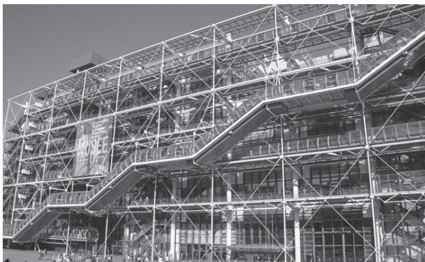
Renzo Piano – Richard Rogers: Centre Pompidou

Ébli ebben a kötetben két szempontból tárgyalja a múzeum intézményének és fogalmának megváltozását. Egyfelől beszél az időszakos és állandó kiállítások arányának és hangsúlyának eltolódásáról, a kiállításban az autentikus tárgyak és a dokumentáció megváltozott viszonyáról. Másfelől vizsgálja a múzeum tevékenységeit, új funkcióit és azok történeti előzményeit. A sikeres kortárs múzeumoknak a korábban mindent meghatározó gyűjtemény bemutatása mellett