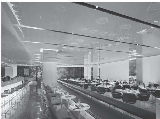
A Modern Művészet Múzeumának (MoMA) étterme, New York

A múzeumi funkciók más kulturális intézményekből ismert funkciókkal keverednek: a múzeum eseményeket szervez ( event culture ), oktatási tevékenységet fejt ki, mindenféle vizuális élményt és vásárlási lehetőséget kínál.