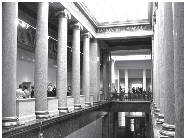
Puskin Múzeum, Moszkva

Mindhárom könyvben, de különösen a Múzeumánia címűben az egyik legfontosabb kérdés az anyagi fenntarthatóság az adott kultúrpolitikai és intézményrendszeri adottságok összefüggésében. Az elsősorban állami fenntartású nagyintézmények mellett szó esik a magángyűjteményekről, a magánmúzeumokról,