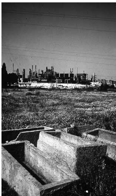
Romok és olajfinomító, Megara