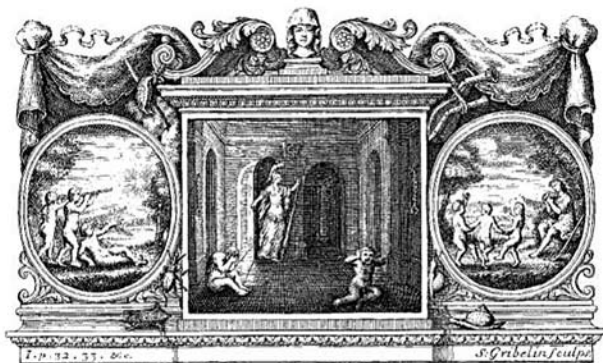
A Letter Concerning Enthusiasm, címlapkép

Persze a levélírára jellemző rögtönzések jellege sok mindenre felmentést ad. De talán fontosabb magya-