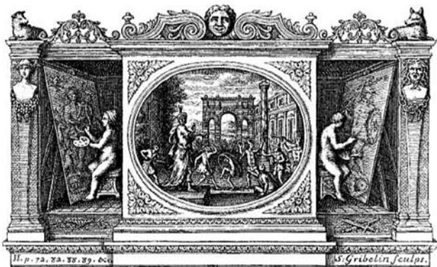
Sensus Communis, címlaplakép

Shaftesbury programja talán legnagyobb visszhangot a német populárfilozófusok körében váltott ki,