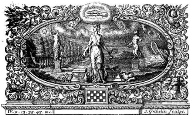
Inquiry Concerning Virtue and Merit, címlapkép

ségtől. Anakronisztikusan azt mondhatjuk, Shaftesbury amellett érvel, hogy a közösség fennmaradását szolgáló evolúciós elv az egyén hozzájárulása a faj jólétéhez és fenntartásához. „Ha az evés és az ivás természetes, a társulás is az. Ha a megkívánás és az érzék minden fajtája természetes, akkor a társas viszony iránti érzéknek is annak kell lennie.” (50. old.) 15 Nos, ez a természetes társas viszony iránti érzék lesz a mű címébe emelt sensus communis fogalom Shaftesbury