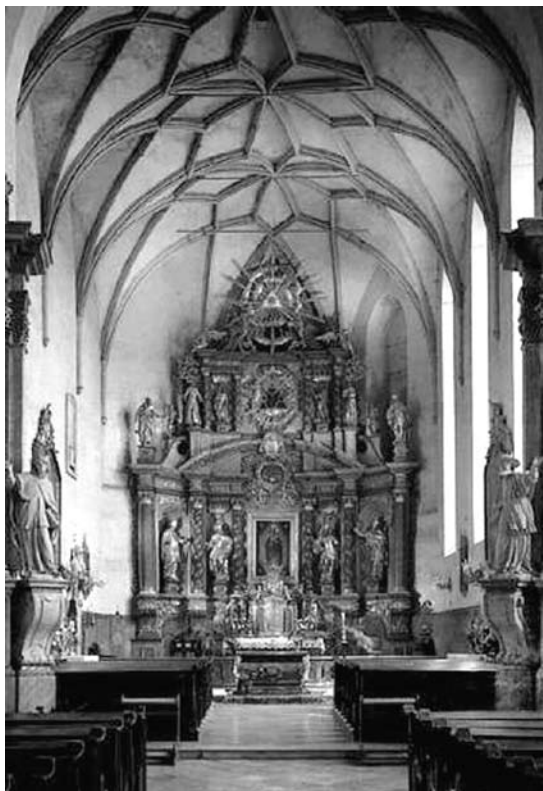
A szeged-alsóvárosi ferences templom

mánya 7 alapján használt. Míg az időben korábbi, 1510 és 1525 közötti formuláskönyv a szakirodalmi hivatkozások alapján könnyen elérhető, 8 addig a másik, 1532 és 1535 közötti leveleket tartalmazó kötet 1950 után került a pesti (mariánus) ferencesektől a nemzeti könyvtár gyűjteményébe, és azóta nem használták fel a történészek. 9 Azzal, hogy Cevins nem találta meg ezt a forrást, nagy lehetőséget szalasztott el, hiszen a XIX. századi tanulmányban csak részlegesen idézett adatok nem pótolják az eredeti dokumentum által kínált információt. Ugyancsak érdemes lett volna legalább röviden utalni arra, hogy az 1862-ben publikált ferences krónikának 10 jelenleg nyolc kézírata ismert – közülük négy a budapesti ferenceseknél, kettő pedig az Országos Széchényi Könyvtárban, vagyis egyáltalán nem elérhetetlen gyűjteményekben. Kétségtelen, hogy az ezekkel kapcsolatos filológiai munka a magyar történettudomány adóssága, nem pedig egy francia történész feladata; ugyanakkor a magyar kutatás erre