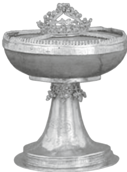
Kapisztrán János serlege

A magyar vikária expanziójának legfontosabb tanulsága, amint ezt Cevins is hangsúlyozza, hogy a terjeszkedés mind dinamikáját, mind pedig abszolút számadatait tekintve európai összehasonlításban is igen látványos, és (amint azt már Fügedi Erik óta tudjuk) 21 alapvetően nélkülözi a városi jelleget. Az obszerváns kolostorok 90 százaléka új alapításként jött létre, és csak kilenc intézményt vettek el a konventuálisoktól. Nyilván ez a viszonylag csekély arány is magyarázza, hogy Magyarországon kevésbé elkeseredett konfliktusok jellemezték a rend két ágának viszonyát, mint Európában. A források hiánya miatt elég nehéz képet alkotni a magyar obszervancia sajátosságairól, a szerző óvatos és finom elemzése azonban a lehetőségekhez képest alapos látéleletet nyújt. Az 1499. évi atyai konstitúciók, a XVI. század eleji formuláskönyv exhortációi és Laskai Osvát prédikációi alapján Cevins megpróbálja európai keretekben elhelyezni a magyarországi mozgalmat. A magyar obszervánsok – a boszniaiakhoz hasonlóan – elzárkóztak az itáliai és a spanyol remete- és misztikus irányzatoktól, és elutasították a franciákra jellemző radikális szegénységmodellt is. Az obszervancia magyar változata tehát egy mérsékelt, konzervatív és intézményközpontú megújulást jelentett, amelynek lényege a regulahűség és a külsőségek pontos megtartása volt. A magyar vikária 1458 és 1502 között nem