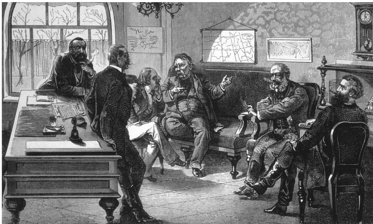
A parlament háznagyai szobájában

1848-ig terjedő időszakot tárgyaló két fejezet (míg Ferenczi ugyanennek az időszaknak az összes terjedeleme több mint egyharmadát szentelte). Ez bizonytalanság, de Molnárnak – aki gyakorlatilag újrairta Deák fiatalkori pályájának történetét – valóban volt mondandója, mégpedig saját kutatásai alapján. Minuciózus gondnal gyűjtött össze mindent, amit Deák őseivel, a családdal, gyermekkorával, tanulmányaiival, majd később olvasottságával, baráti körével