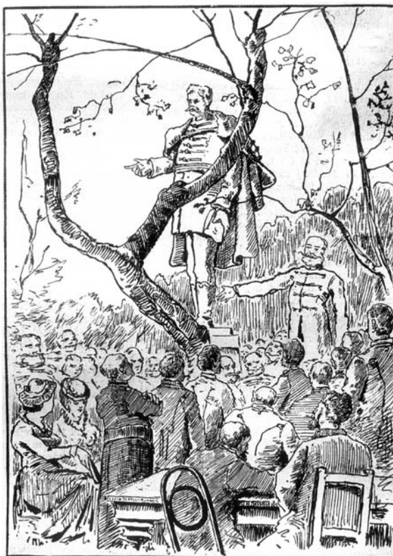
Szoboravatás Zalaegerszegen. Feszty Árpád rajza

Csapó Vilmos visszaemlékezésére, illetve Deák leveleire alapozva Deák Ágnes a dom-