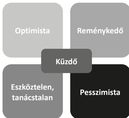
2. ábra. Az online mentorálás során feltárt különböző mentortípusok